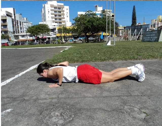
Foto 11: Posição Inicial e Final ( Posição “um”) -Visão Lateral Foto 12: Posição “Dois” - Visão Lateral